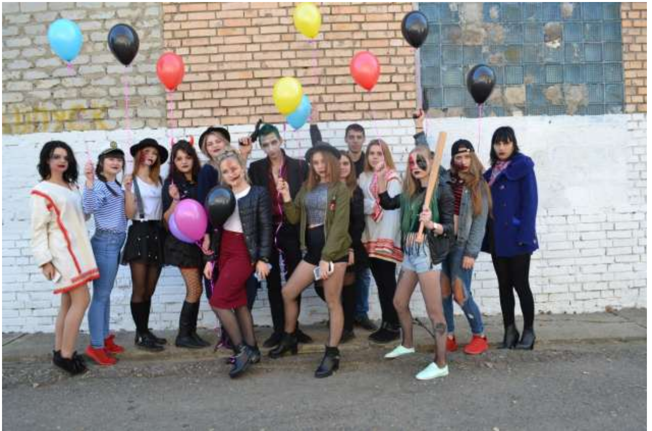
Заводилы и организаторы праздника группы 3.3 «повар, кондитер», 4.3 «парикмахер»