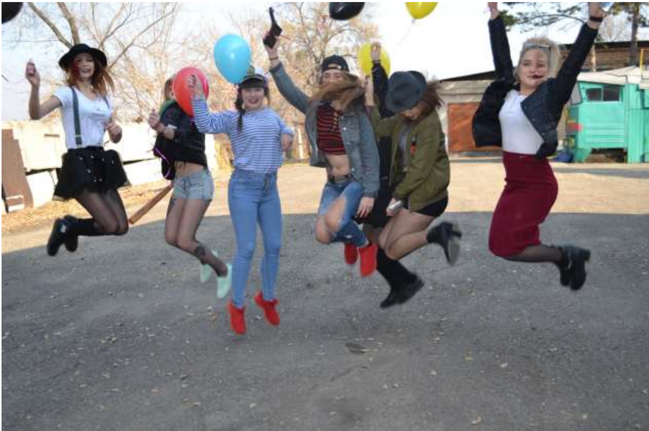
Земля – прощай... В добрый путь!